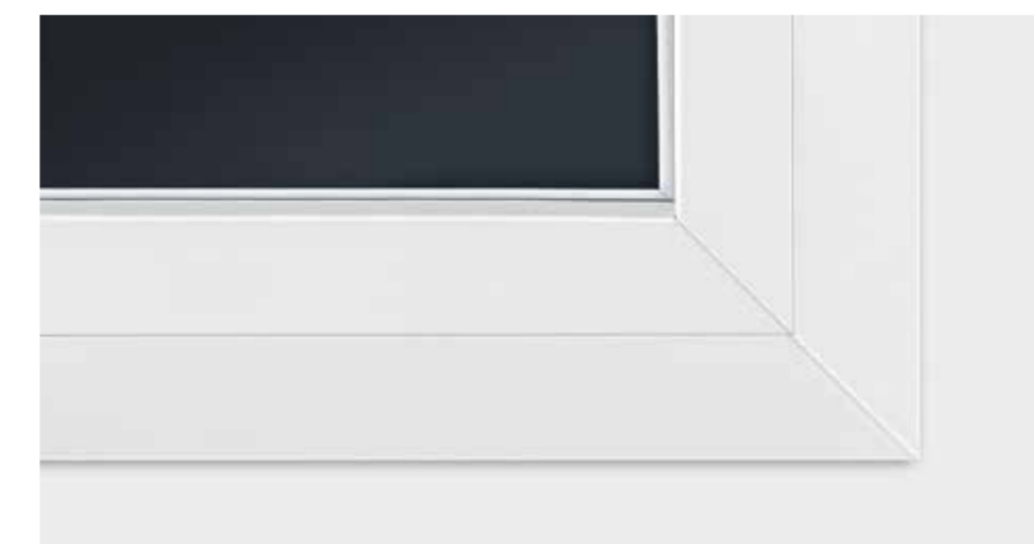
Reduzierte Optik durch verdeckten Beschlag